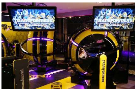
バンブルビーカラー筐体