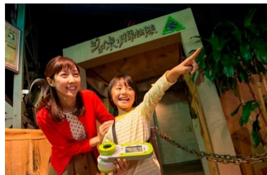
ジョイポリ探検隊 ダイバーの秘宝と謎の紋章 イメージ