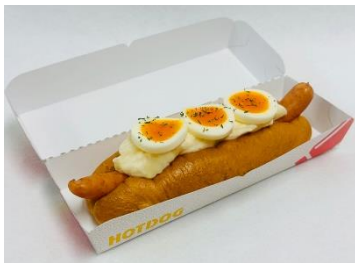
イースタードッグ 450円(税込)