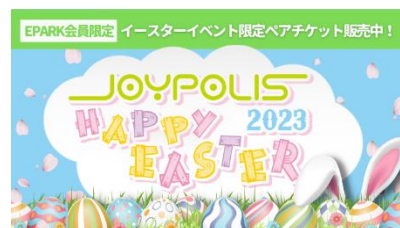
イースター ペアパスポート