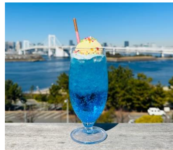
イースターカラフルクリームソーダ 700円(税込)