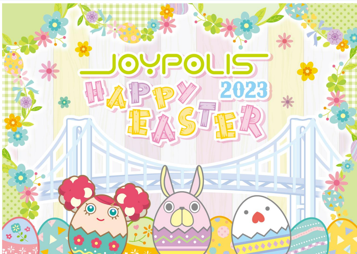
< イベントメインビジュアル >