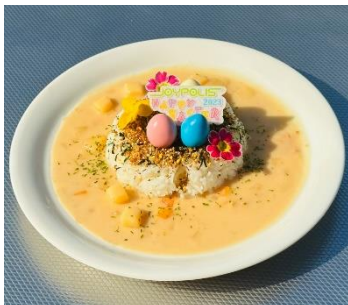
イースタータマゴのシチュライス 1,200円(税込)