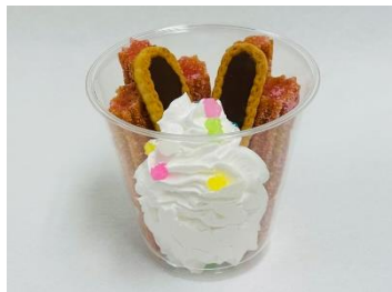
イースターパフェ 500円(税込)