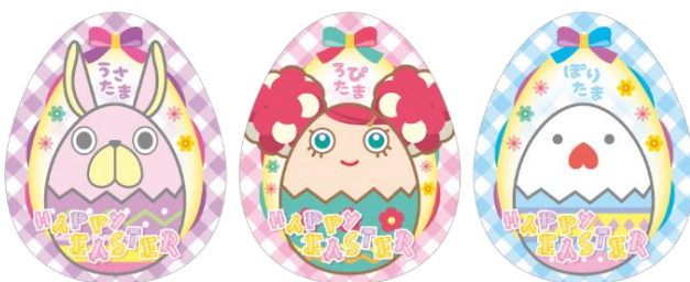
イースター限定ステッカー イメージ