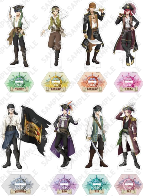
アクリルスタンド(全8種) 各1,500円(税込)

※「アニメイト通販」での販売受付開始日は、2024年9月28日(土)12時予定です。