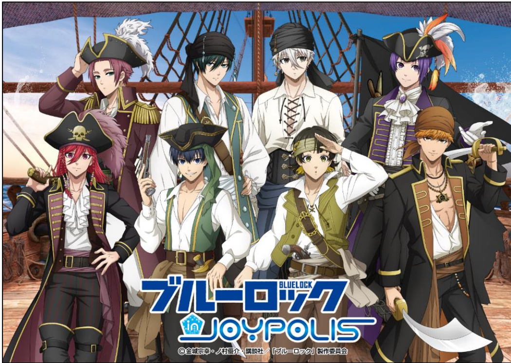
<イベントメインビジュアル>

CAセガジョイポリス株式会社(本社:東京都品川区、代表取締役:吉本 武)が運営する東京・台場の屋内型テーマパーク「東京ジョイポリス」は、TVアニメ『ブルーロック』とのコラボレーションイベント「ブルーロック in JOYPOLIS 2」を、2024年6月28日(金)から2024年9月23日(月祝)まで開催いたします。