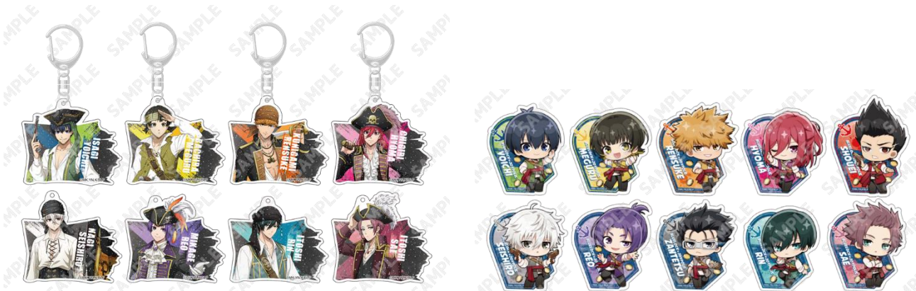
大当たり:トレーディングラメ入りアクリルキーホルダー(全8種)