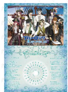
「フォーチュンフォレスト」 占い結果用紙イメージ(全1種)