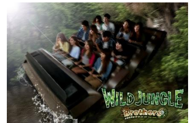
ワイルドジャングル ブラザーズ イメージ