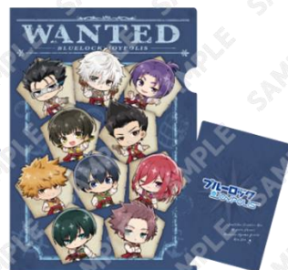
クリアファイルセット(全1種) 1,200円(税込)