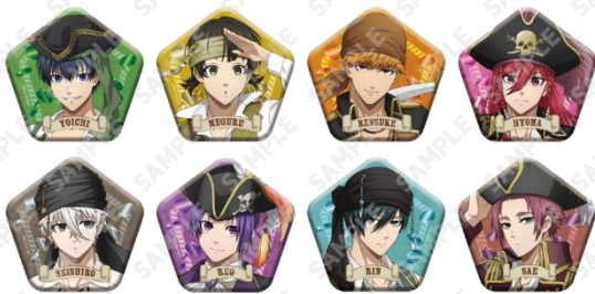
トレーディング五角形缶バッジ(全8種)500円(税込) ※ランダムに封入して販売の為、絵柄はお選びいただけません。