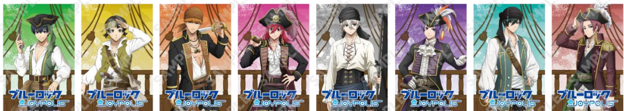
参加賞:トレーディングクリアカード(全8種)