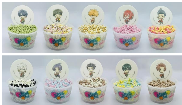
コラボアイス(全10種) 各700円(税込)