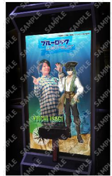
デジタルコンテンツイメージ