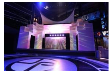
メインステージイメージ