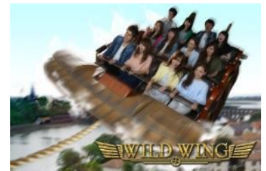
ワイルド ウイング イメージ