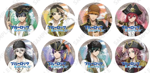
トレーディングクリアコースター(全8種)