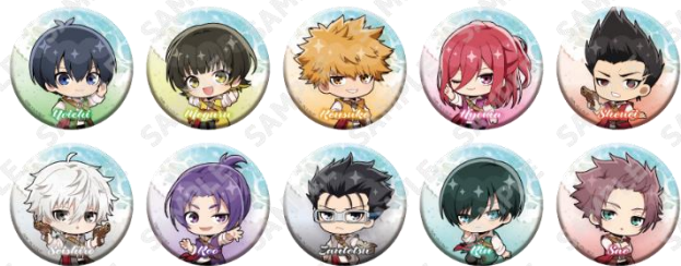
トレーディング缶バッジ(全10種) 500円(税込) ※ランダムに封入して販売の為、絵柄はお選びいただけません。