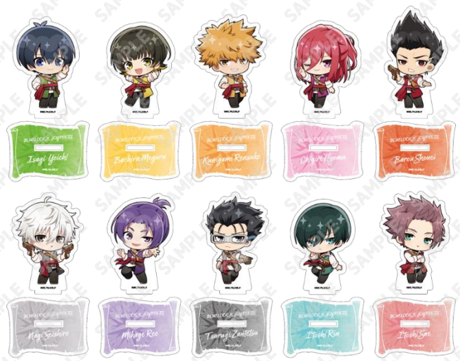
トレーディングミニアクリルスタンド(全10種) 850円(税込) ※ランダムに封入して販売の為、絵柄はお選びいただけません。