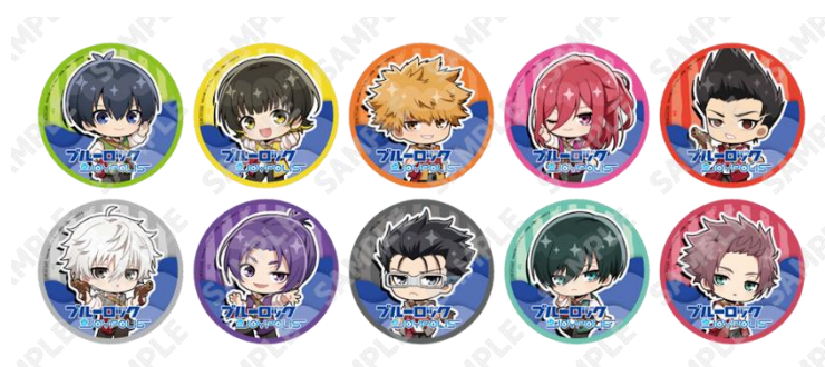
トレーディングステッカー(全10種)