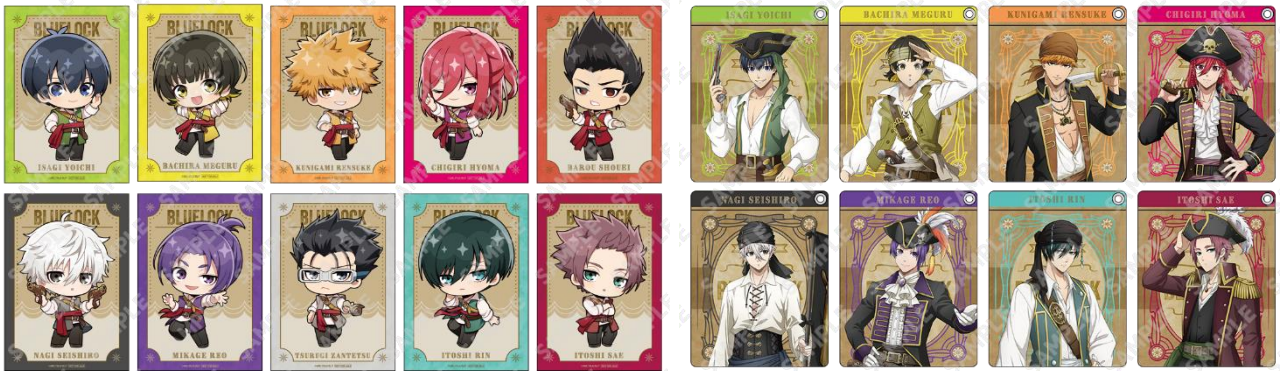
トレーディングミニカード(全10種)

・「パスポート」(入場+アトラクション乗り放題+トレーディングミニカード+パスケース):大人 6,500円 / 小中高生 5,500円