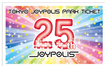
25周年記念デザインチケット

さらに、エントランスゲートやフォトスポットなど、館内にも25周年記念の装飾が登場します。