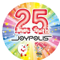
ノベルティ ステッカー