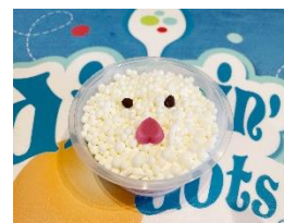
ジョイポリくんフレーバー