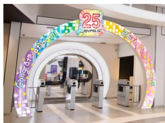
エントランス装飾イメージ