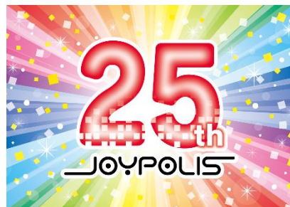
東京ジョイポリス 25周年ロゴ

これまででも、そして、これからも、挑戦と進化を続ける「東京ジョイポリス」にどうぞご期待ください！